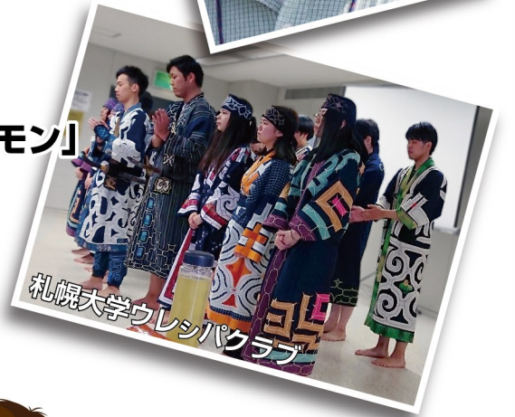
札幌大学ウレシパクラブ